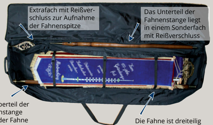
Extrafach mit Reißverschluss zur Aufnahme der Fahnenstange