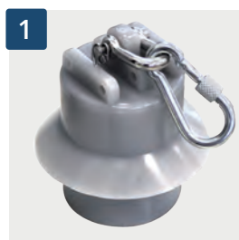
1 Kletterstoppgewicht (schallgedämpft)